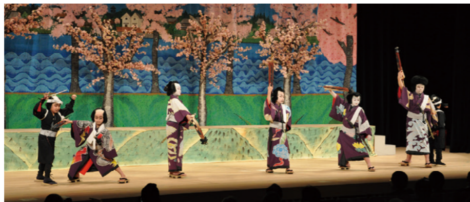
花の木小学校かぶきクラブ