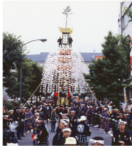
中近笠鉾 (花笠あり)

秩父夜祭では2つの笠鉾と4つの屋台、合わせて6つの山車をそれぞれの出発点から地いきごとに協力してひきます。