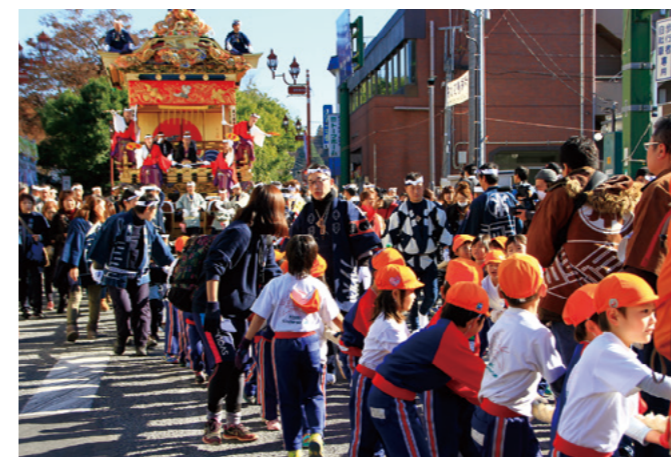
幼稚園児が祭りに参加する様子