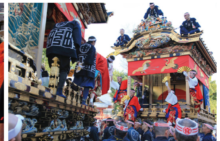
屋台に乗るはやし手