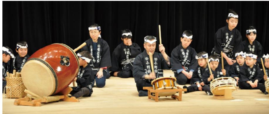
ほぞん保存会の方が指どうする本町子どもたいこ教室