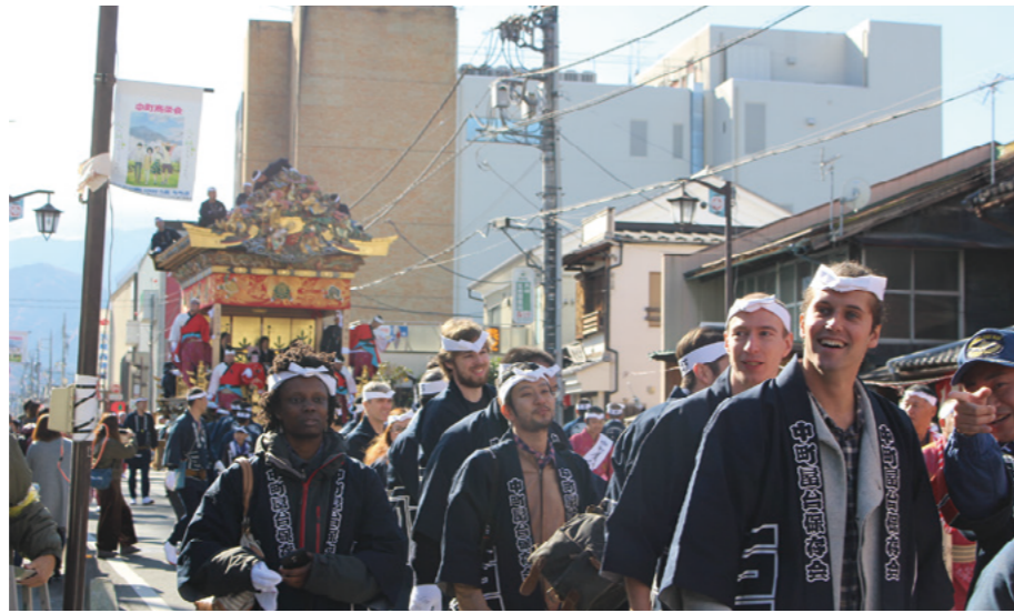
海外の人たちを祭りにしようとした時の様子

「近くの神社などとも深い関係がありそうだね。世界でもみとめられているなんてすごいね。」