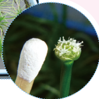
マッチ棒と対比した花